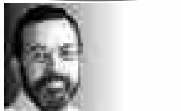
vicepresidente USS Ticino e Moesa

"On the offensive, for social Europe, solidarity, sustainability", ossia "all'offensiva, per un'Europa sociale, solidarietà, sostenibilità". È sotto questo slogan che si è svolto dal 21 al 24 maggio 2007 a Siviglia, alla presenza di 1'000 delegati, l'undicesimo congresso della Confederazione europea dei sindacati (CES), che raggruppa 81 sindacati di 36 Paesi europei. Il Congresso ha fatto un bilancio critico della politica neoliberale condotta dall'Unione europea, che ha privilegiato gli aspetti economici e trascurato quelli sociali. I lavoratori di tutto il continente stanno vivendo grosse difficoltà: disoccupazione, precariato, bassi salari, attacchi alle pensioni, servizi pubblici meno efficienti sono le caratteristiche di questo periodo. Il congresso ha preso atto di questo bilancio negativo e ha deciso di passare all'offensiva, di costituirsi in un reale contro-potere delle Istituzioni dell'Unione europea, in particolare della Commissione, con l'obiettivo di concretizzare il "modello sociale europeo".