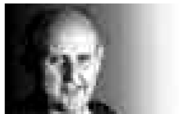
presidente USS Ticino e Moesa

Riforma del secondo pilastro bloccata a Berna