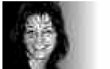
segretaria aggiunta VPOD Ticino

All'inizio di quest'anno il nostro sindacato si è fatto promotore nel costituire il Coordinamento delle commissioni interne del personale dei sei Servizi di aiuto domiciliare cantonali per portare avanti il progetto di un contratto collettivo di lavoro (CCL) unico cantonale. Nel Cantone esistono, infatti, due CCL, uno nel Sotto e uno nel Sopraceneri, da quando, otto anni fa, si sono sciolti i Consorzi e si sono costituiti i sei Servizi di aiuto domiciliari. Ricordiamo che in quell'occasione con il personale abbiamo condotto una grossa battaglia per mantenere le condizioni contrattuali che esistevano prima del cambiamento giuridico dei Consorzi senza però riuscire ad ottenere un unico CCL.