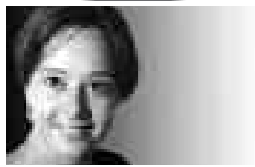
segretaria VPOD Ticino

Grande successo la giornata d'azione organizzata dal Sindacato SSM