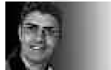
funzionario sindacale VPOD

Lo scorso 30 maggio il Sindacato VPOD ha incontrato in assemblea il personale (circa 30 persone) della Casa Anziani Rea di Minusio. L'assemblea aveva lo scopo di fornire un feedback al personale sulle discussioni avvenute tra Sindacato, Direzione e il Municipio sul presunto furto all'interno della Casa, furto rivelatosi in seguito uno smarrimento da parte dell'ospite e di cui abbiamo già riferito nei Diritti per le conseguenze nefaste sul personale. Durante l'incontro con il Sindaco è stata pure discussa l'eventualità di aderire per Casa Rea al contratto collettivo di lavoro, (ROCA): lo stesso Sindaco ha proposto d'indire un incontro con la Direzione per discutere sull'entrata in materia. Durante l'assemblea del 30