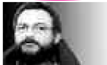
funzionario sindacale VPOD

IL CSI ha richiesto un chiarimento a Roma