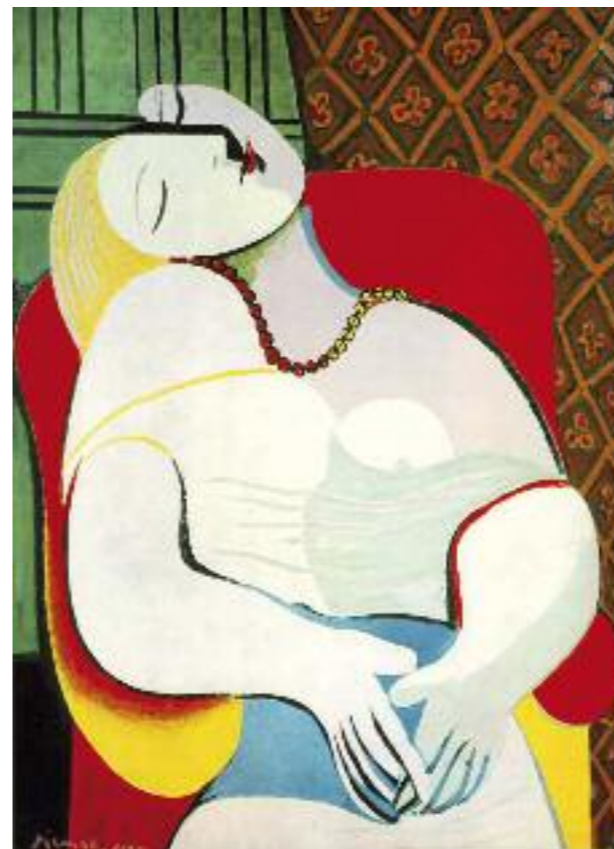
Pablo Picasso, Il sogno, 1932

Non ci sembra ragionevole una simile vessazione finanziaria per delle lavoratrici e dei lavoratori, che hanno solamente dimenticato di riempire un modulo 6 anni fa, senza che in seguito venissero più sollecitate. Il lasso intercorso tra il periodo di allestimento del modulo e l'avvio dei controlli impone l'introduzione di una moratoria, a tutela dei diritti dei frontalieri. Per questo il granconsigliere Raoul Ghisletta, appoggiato da numerosi altri deputati socialisti, ha chiesto al Consiglio di Stato di istituire una moratoria per l'affiliazione retroattiva alla cassa malati per il periodo 2002-2008 e di ridare la possibilità di opzione per l'assicurazione malattia ai frontalieri che non l'hanno esercitata nel 2002. Il Sindacato VPOD attende una risposta ragionevole da parte del Governo al problema.