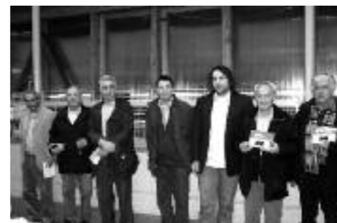
I veterani VPOD festeggiati durante l'assemblea