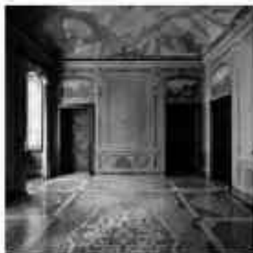
PIENI&VUOTI Interni di case storiche ticinesi fotografate da Roberto Pellegrini

Pinacoteca Cantonale Giovanni Züst, Rancate dal 29 marzo al 16 agosto 2009