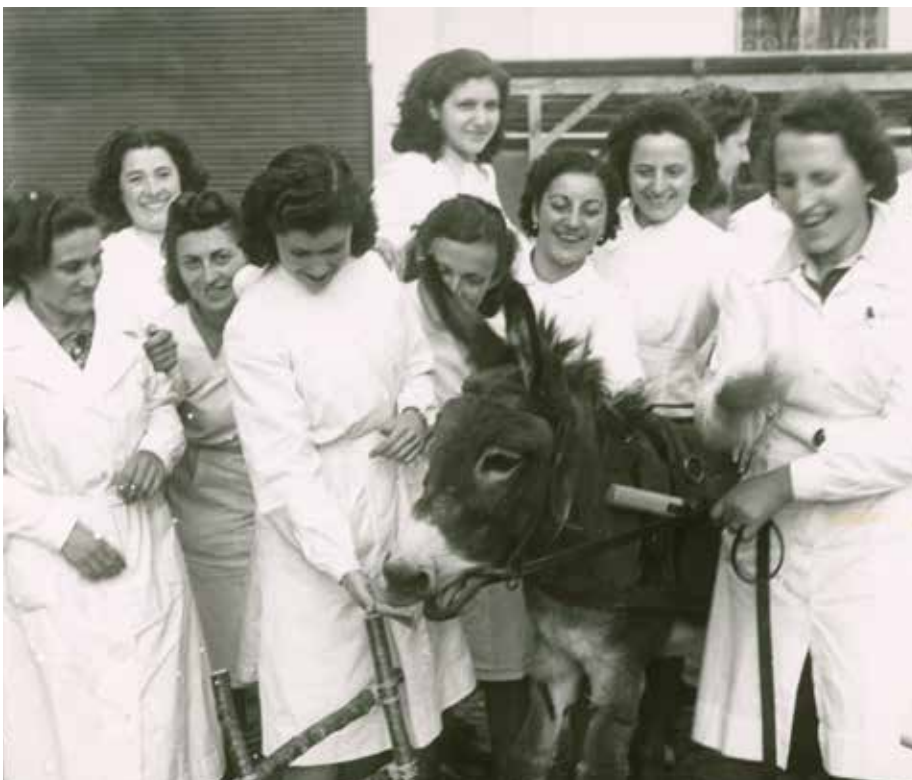
Infermiere dell'ospedale neuropsichiatrico di Casvegno, 1941 circa