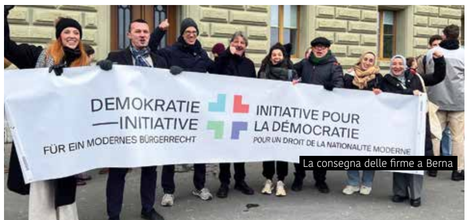
La consegna delle firme a Berna

cambio di paradigma nel diritto di cittadinanza svizzero: chiunque viva qui in modo stabile e soddisfi criteri oggettivi ed esaustivi deve avere diritto alla naturalizzazione. Le procedure di naturalizzazione devono essere semplificate ed è necessario porre fine all'arbitrarietà. L'iniziativa per la democrazia è la prima e unica iniziativa popolare a favore di una "politica degli stranieri" progressista dai tempi dell'Iniziativa "Essere solidali", lanciata esattamente 50 anni fa. Dobbiamo, ancora una volta, rafforzare la nostra democrazia – per tutte le persone che qui sono a casa.